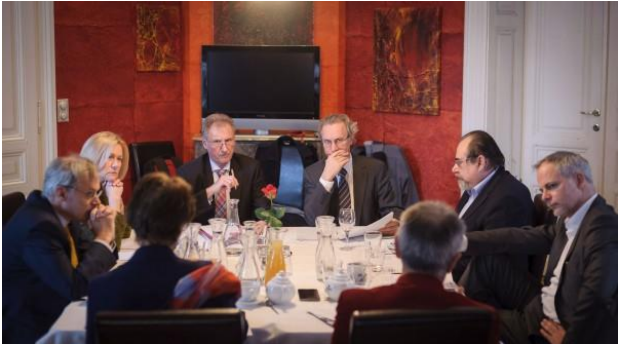
Spannende Diskussion beim VBV-Zukunftsdialog 2013